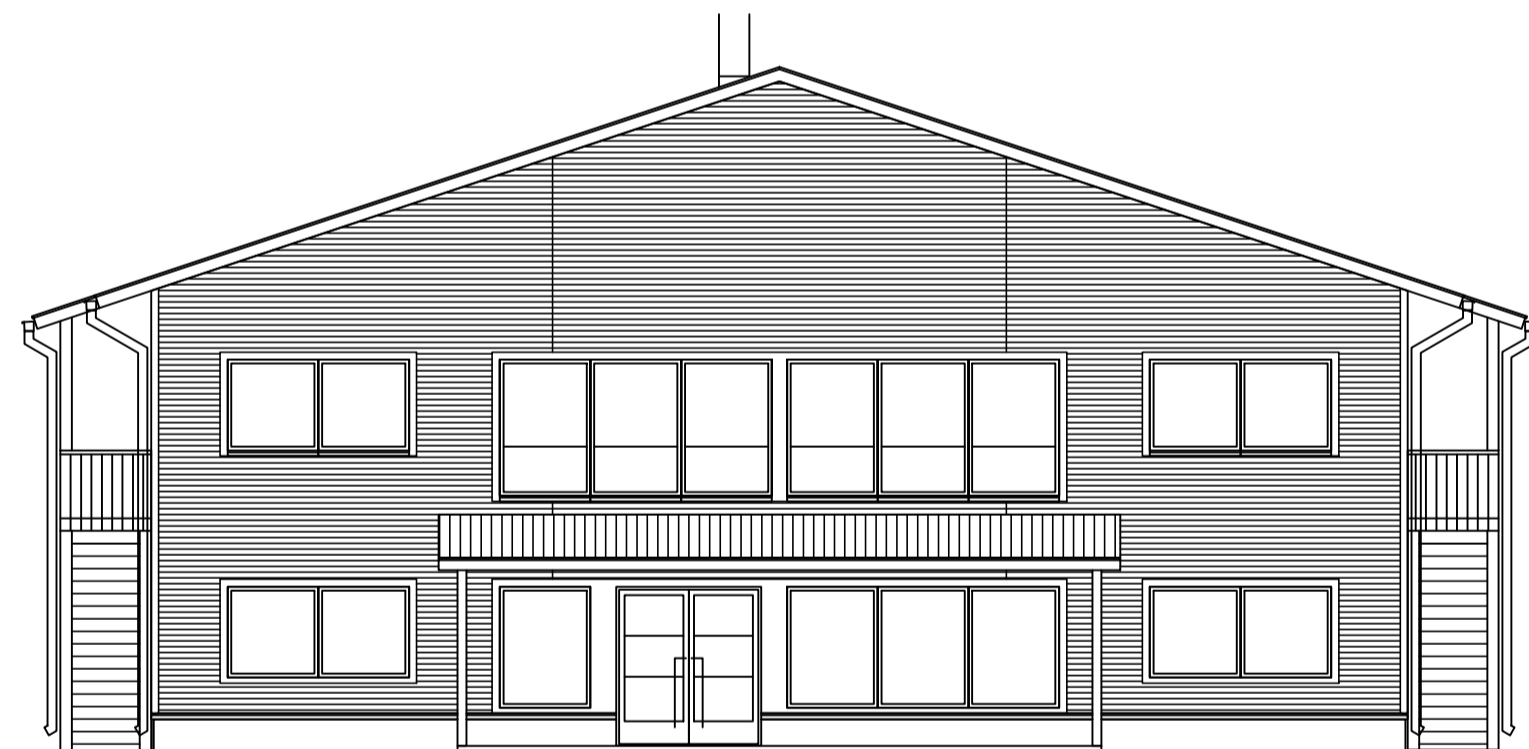
JULKISIVU KAAKKOON (KALLIOKAARENTELLE)